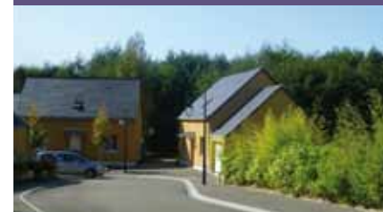
PRÉSERVATION DES MILIEUX NATURELS