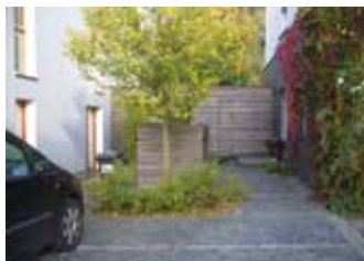
MATÉRIAUX SAINS ET ÉCOLOGIQUES