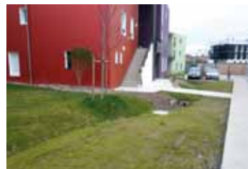
RÉCUPÉRATION ET GESTION DE L'EAU