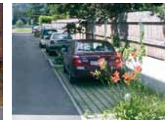
PERMÉABILISATION DES SOLS